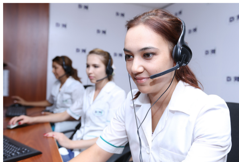
Контакт-центры страховых медицинских организаций работают во всех регионах нашей страны.

А с января 2018 года наступит третий этап становления института страховых представителей - приступят к работе страховые представители третьего уровня. Они будут заниматься организацией информирования и сопровождения застрахованных лиц при госпитализации, формированием приверженности к лечению, взаимодействию с медицинскими организациями для уточнения причин нарушения очередности и доступности специализированной медицинской помощи, оказываемой в стационарных условиях, своевременностью и профильностью плановой госпитализации.